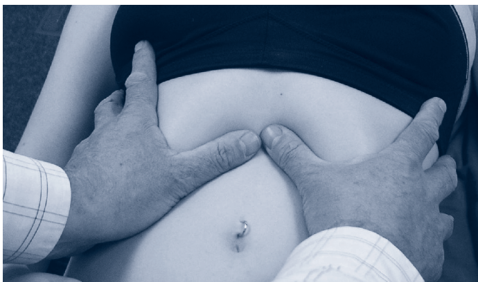
01 Die Hände legen sich dem rechten und linken unteren Thorax an, die Daumen liegen unterhalb des Rippenbogens und nehmen von innen Kontakt mit dem Diaphragma rechts und links, der Patient atmet unaufgefordert, spontan und unwillkürlich auf.