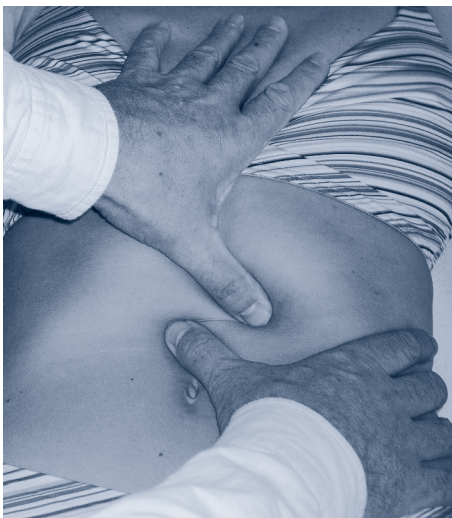
3 Bimanuelle Palpation des Magens